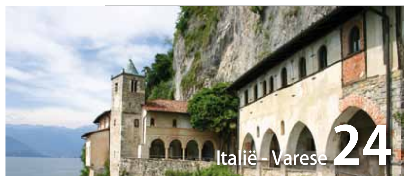
Italië - Varese 24