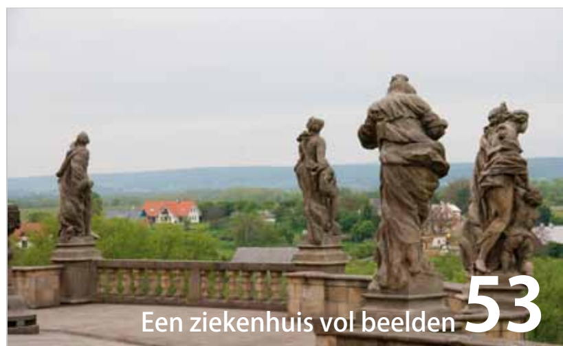
Een ziekenhuis vol beelden 53