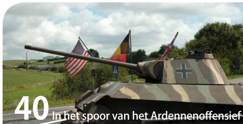
40 In het spoor van het Ardennenoffensief