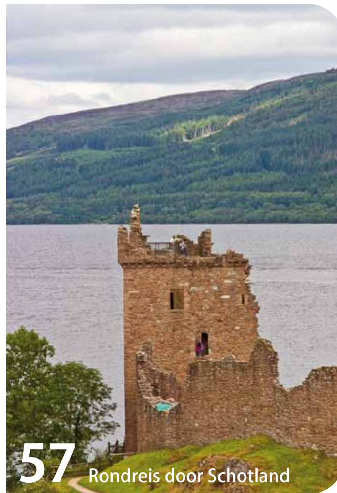
57 Rondreis door Schotland