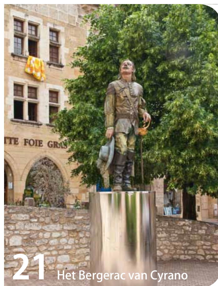
21 Het Bergerac van Cyrano