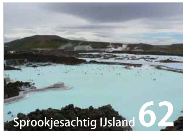
Sprookjesachtig IJsland 62