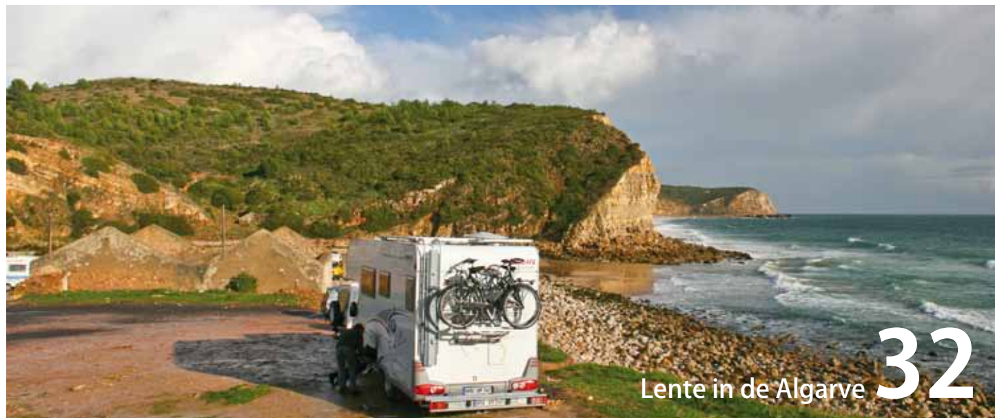
Lente in de Algarve 32