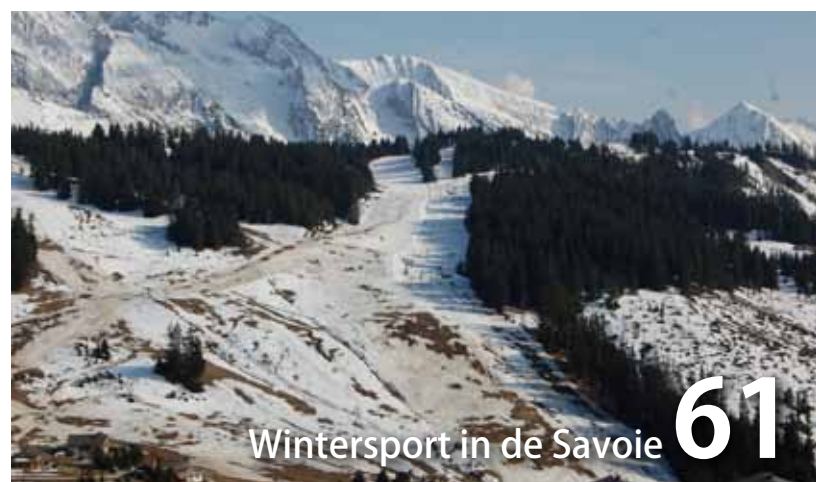
Wintersport in de Savoie 61