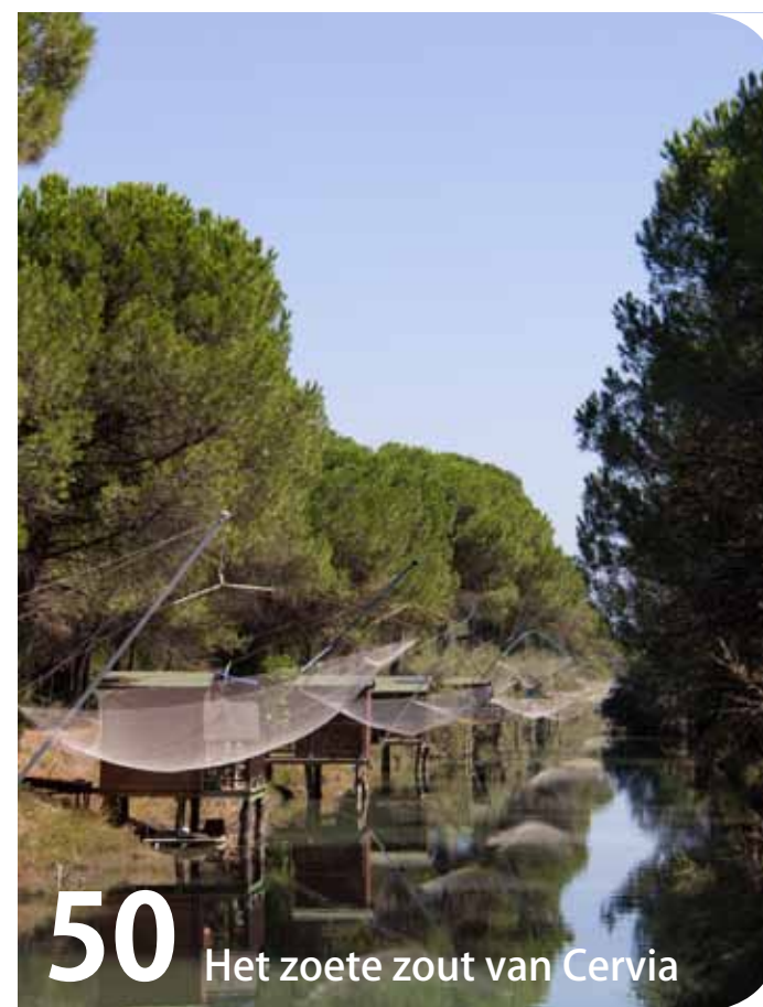
50 Het zoete zout van Cervia