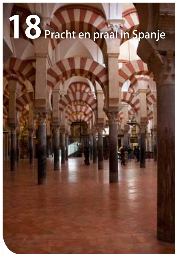
18 Pracht en praal in Spanje