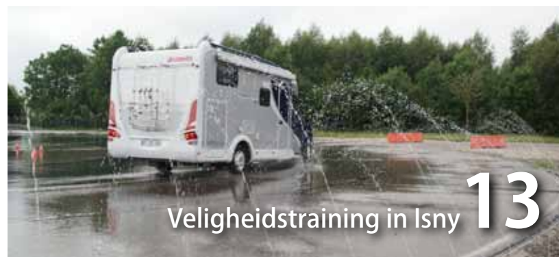
Veiligheidstraining in Isny 13