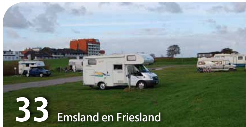
33 Emsland en Friesland