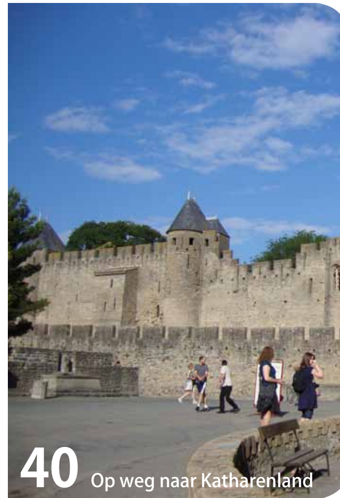
40 Op weg naar Katharenland