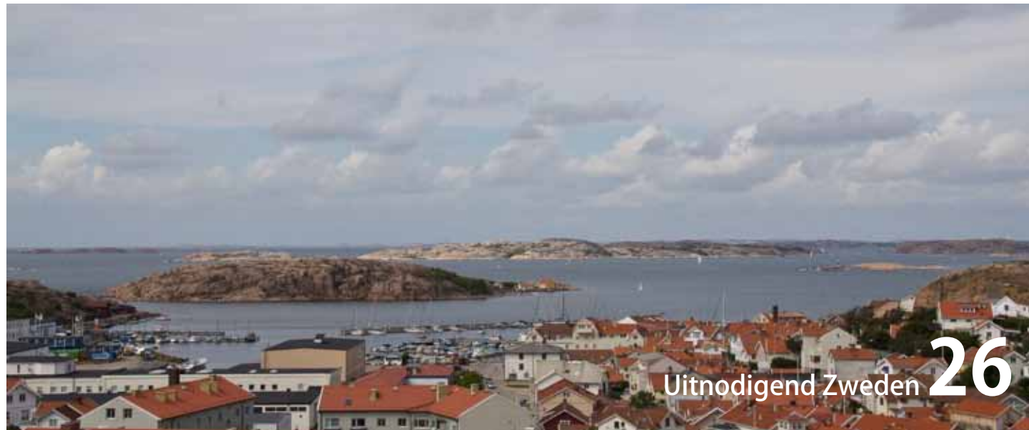
Uitnodigend Zweden 26