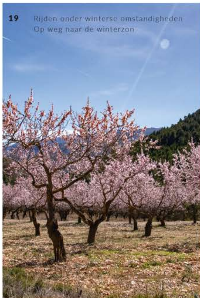
19 Rijden onder winterse omstandigheden Op weg naar de winterzon