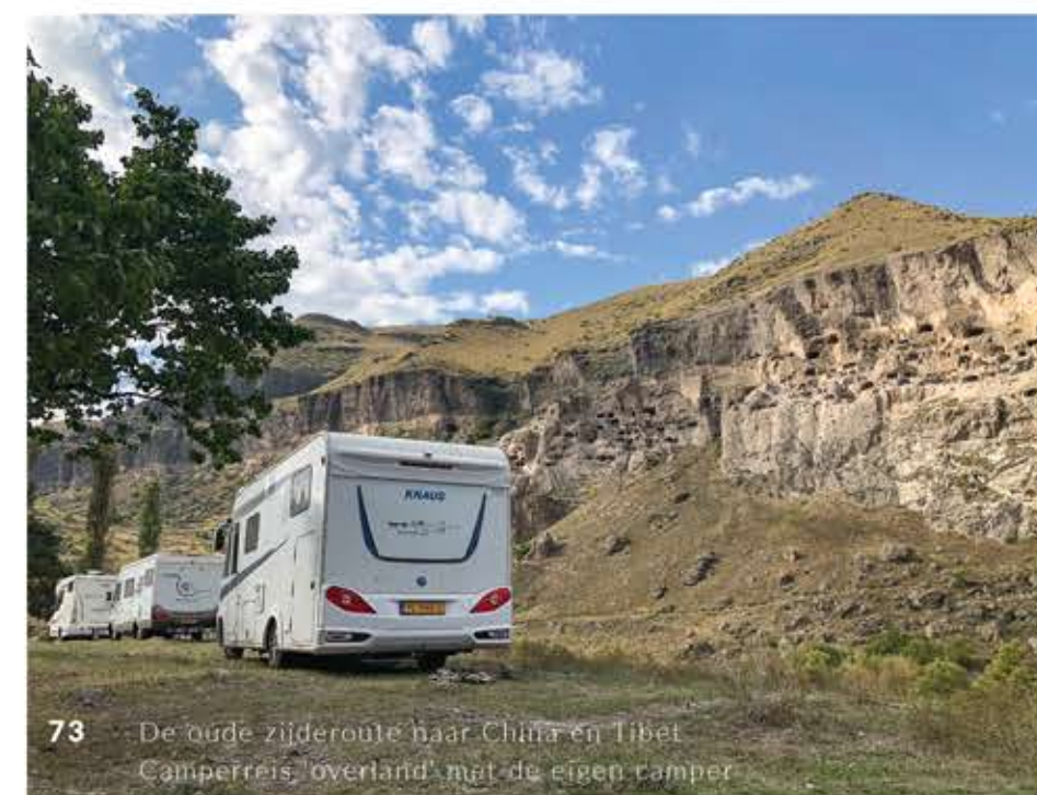
73 De oude zijderoute naar China en Tibet Camperreis 'overland' met de eigen camper