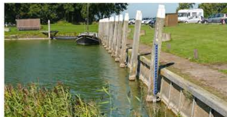
13 Nederland Fietsen door Gaasterland