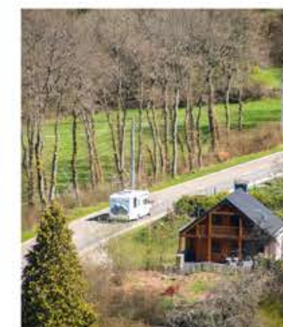
93 CP Herbeumont (B)