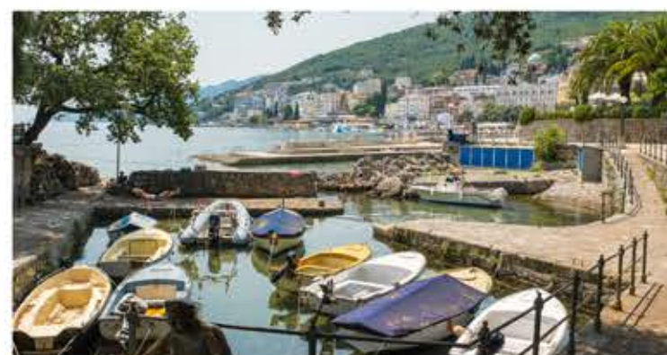
30 Kroatië Veel meer dan zon, zee en strand