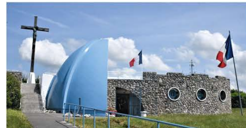
57 Frankrijk Langs de côte d'Opale