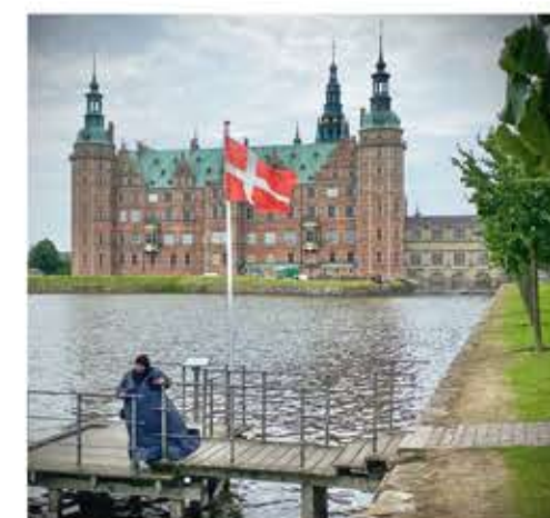
45 Denemarken Roadtrip door het land van Margrethe